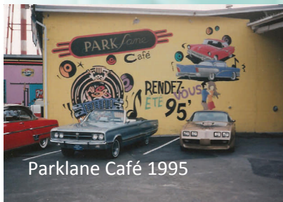
Parklane Café 1995